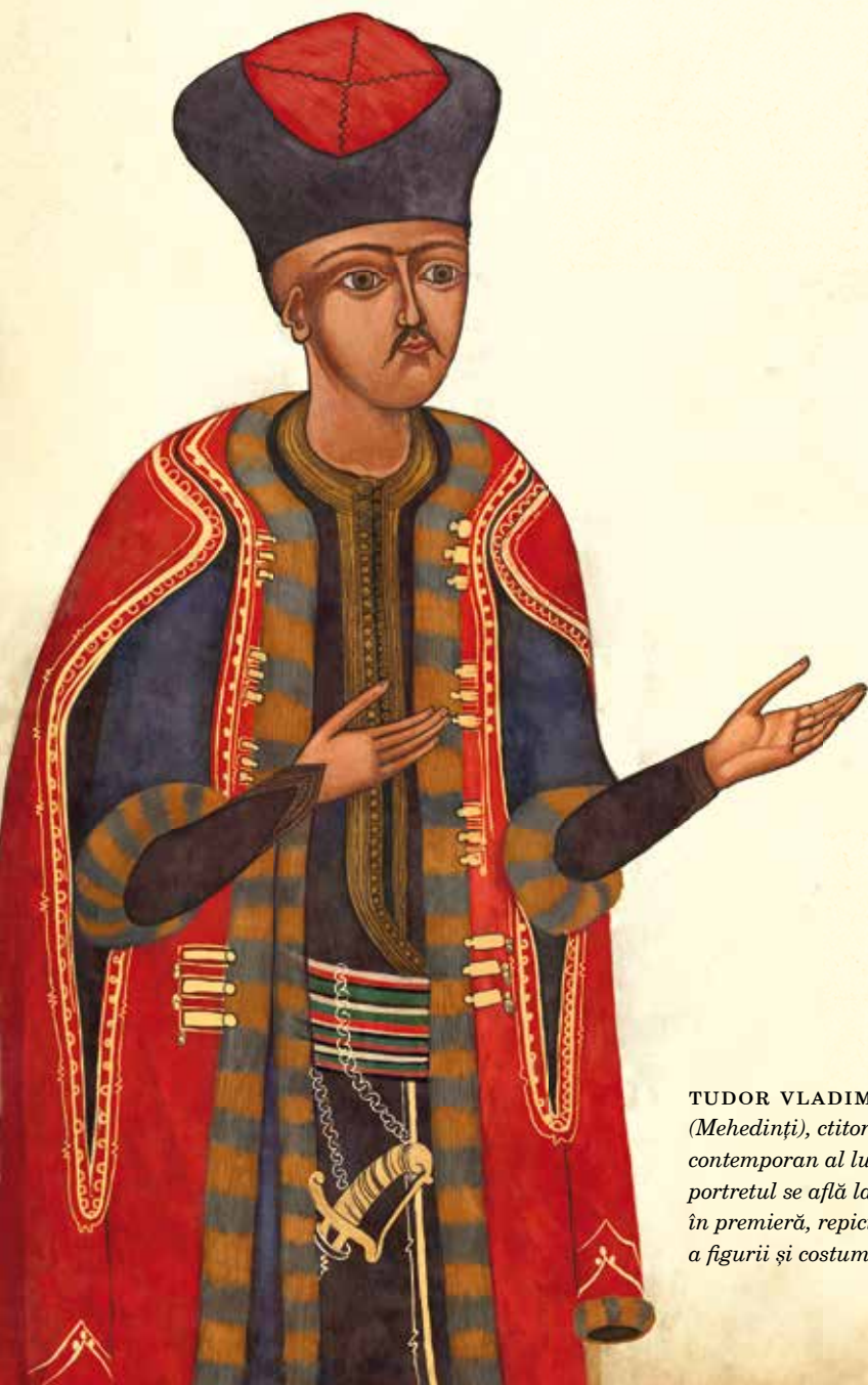
TUDOR VLADIMIRESCU , portret votiv pe lemn din biserica de la Prejna (Mehedinți), ctitorită de el împreună cu Gheorghe Duncea. Este singurul portret contemporan al lui Tudor. Biserica nu mai există astăzi în forma originală; portretul se află la Muzeul Național de Artă, degradat. L-am restaurat virtual, în premieră, repictându-l în cele mai mici detalii. Pentru reconstituirea realistă a figurii și costumului lui Tudor așa cum sunt zugrăvite aici, vezi p. 19.